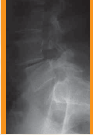
Şekil: Omurga arkasındaki çatlak ve kayma göstermektedir.

Omurga, omur adı verilen birbirine bağılı kemik yapılarından oluşmuştur. Erişkin insanların yaklaşık %5'inde daha çok alt omurga ile kuyruk kemiği (sakrum) arasında görülen gelişimsel bir çatlak bulunur. Bu çatlak bir stres kırığı olarak oluşabilir. Beli etkileyen sabit kuvvetlerin etkisiyle bu kırık genellikle normal kemik gibi iyileşmez. Böyle bir kırık spondilolizis olarak adlandırılır ve omurun bir kısmını içeren basit bir çatlaktır ve bu haliyle ciddi bir sorun yaratmaz. Fakat bazen çatlamış olan omur, alttaki omurun üzerinden öne doğru kayar. Bu durum erişkin istmik spondilolizis olarak adlandırılır.